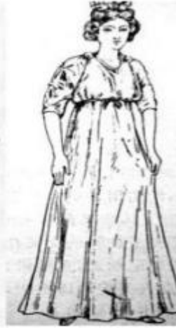
图3 穿高腰希顿的古希腊女人